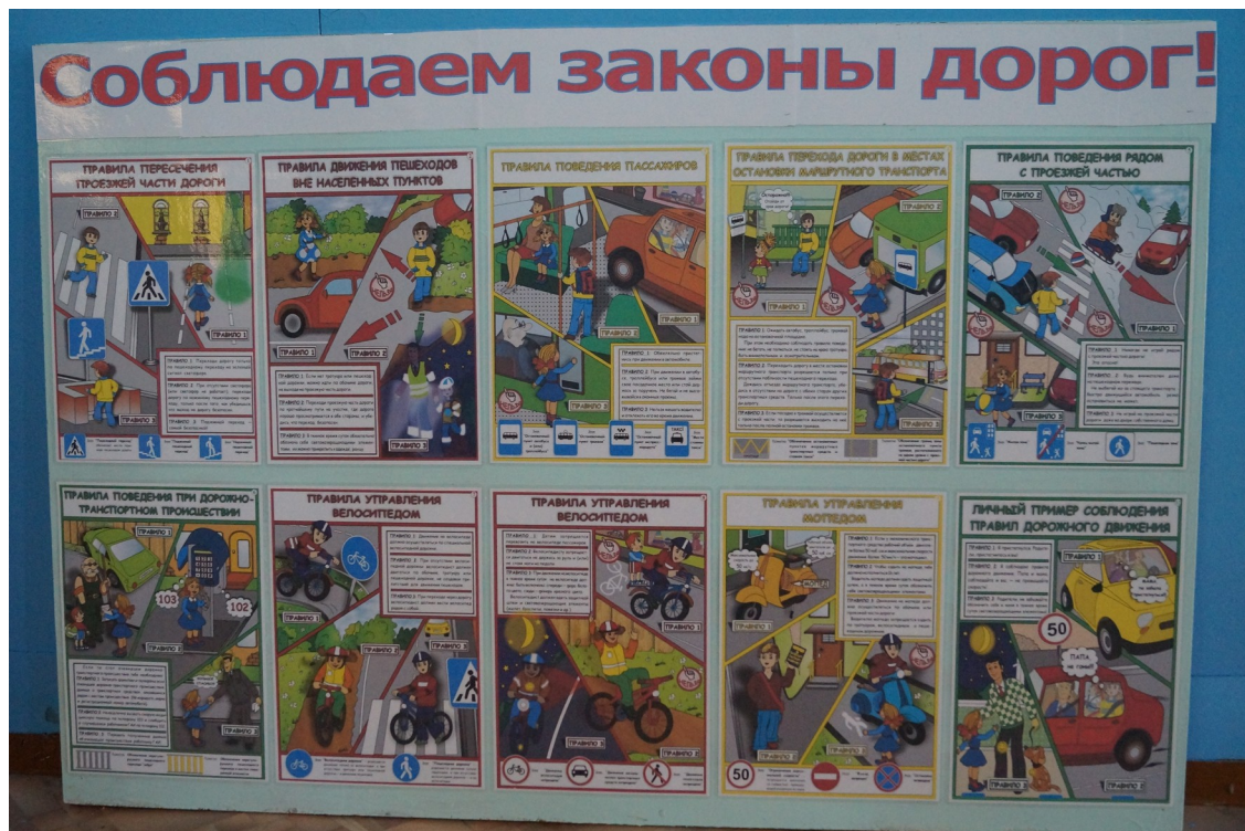
Стенд расположен в коридоре здания №1 по адресу : п.Коноша, ул.Вологодская, 25