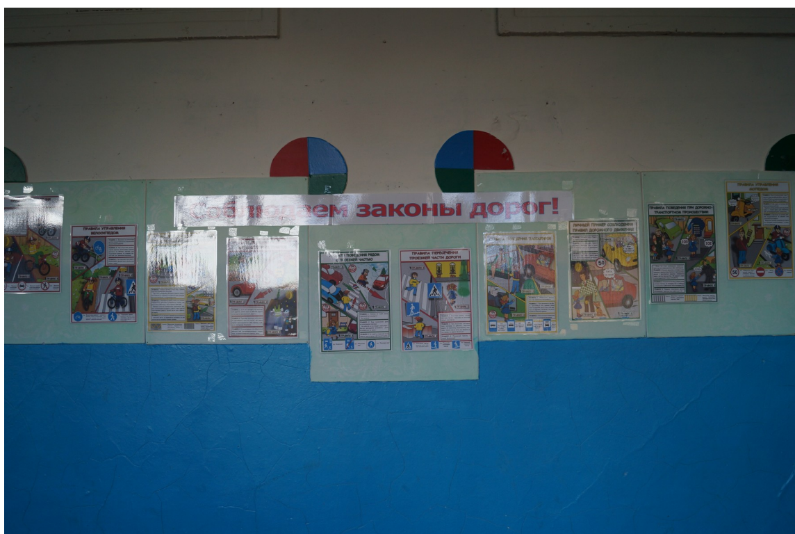
Стенд расположен в коридоре здания №2 по адресу : п.Коноша, ул. Тельмана, д.4а